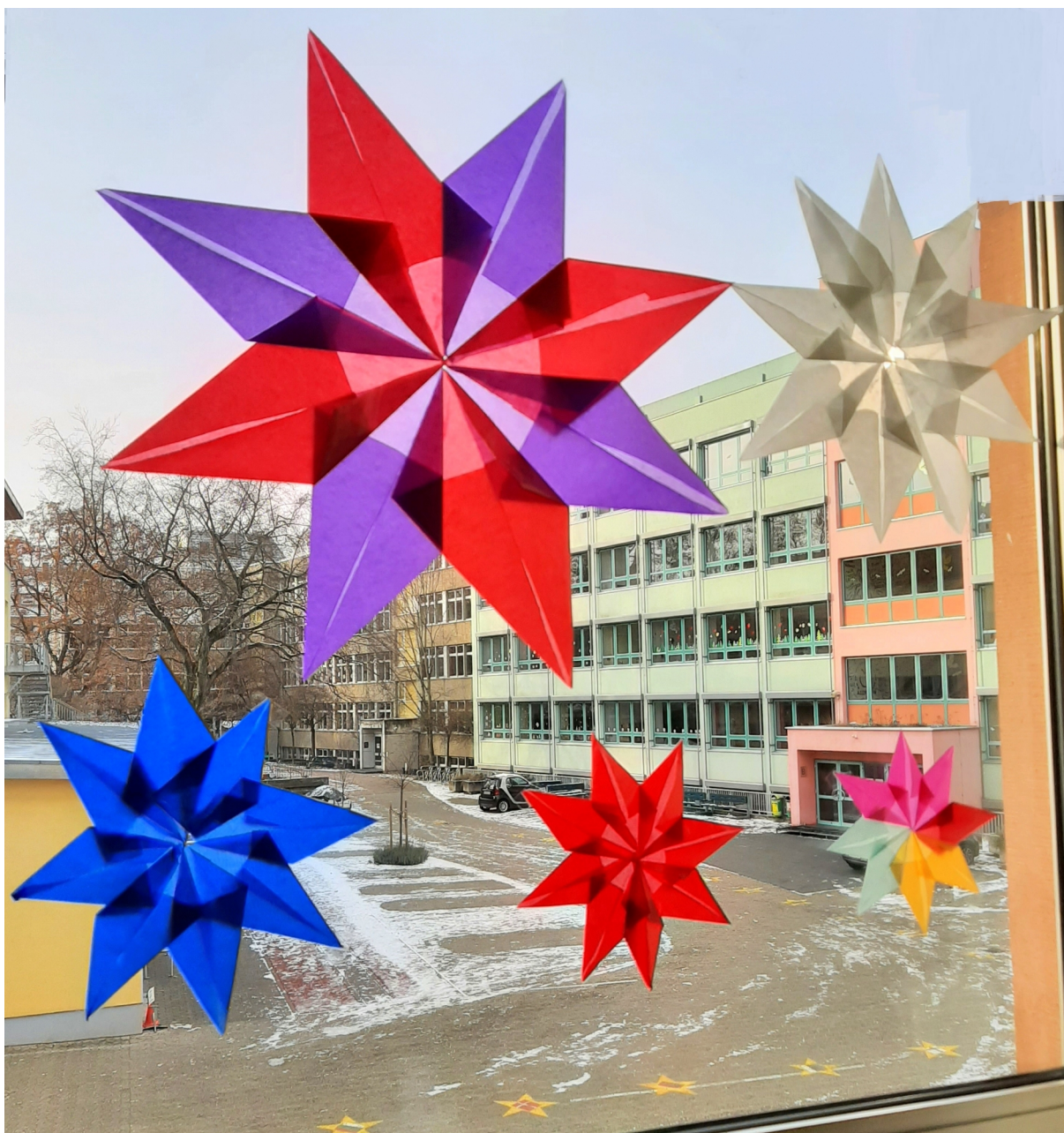
Weihnachtsschmuck in unseren Schulen