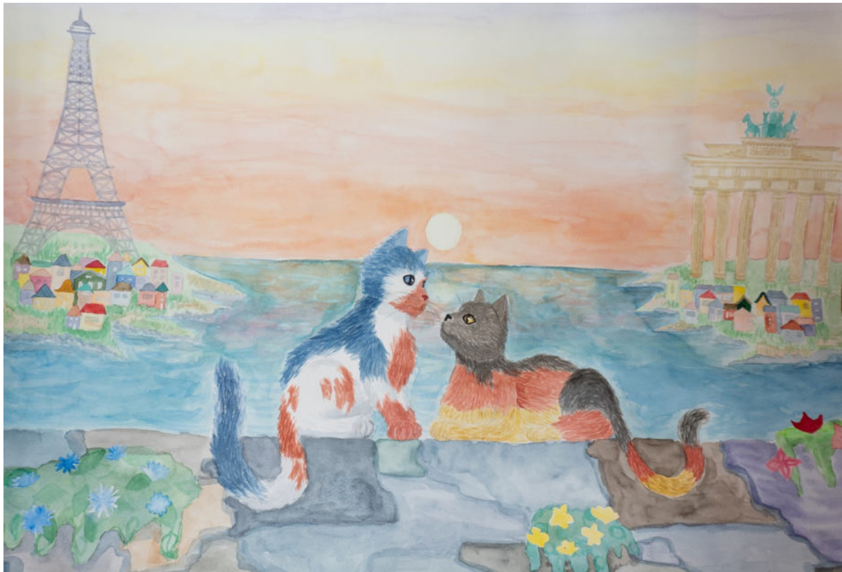
Platz 2 im Malwettbewerb: Zoe Chiara Keese (MSS 13)