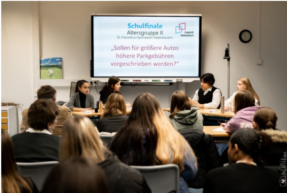
Die Debattantinnen bei der Arbeit

Die jeweiligen Kurssiegerinnen debattierten die Frage: „Sollen größere Autos eine höhere Parkgebühr zahlen?“