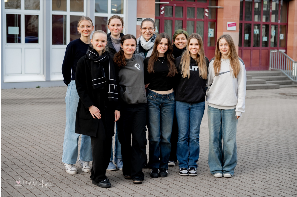
Die Debattantinnen und Jurorinnen

Am 24.01.2024 traten die Schulsiegerinnen und -sieger des Regionalverbands Kaiserslautern im Albert-Schweizer-Gymnasium gegeneinander an. Ausgerichtet wurde der Regionalvorentscheid, bei dem es um den Einzug ins Regionalfinale ging.