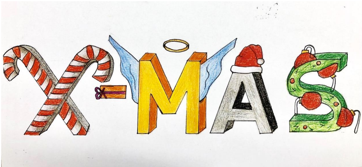
Paula Böhm, 8c (in 2023)