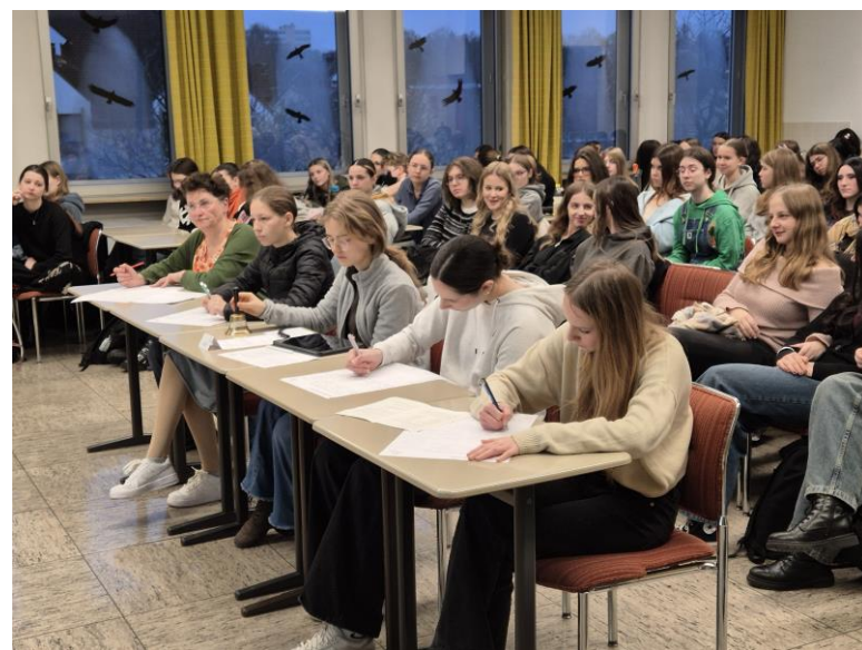
Eine hochkonzentrierte Jury