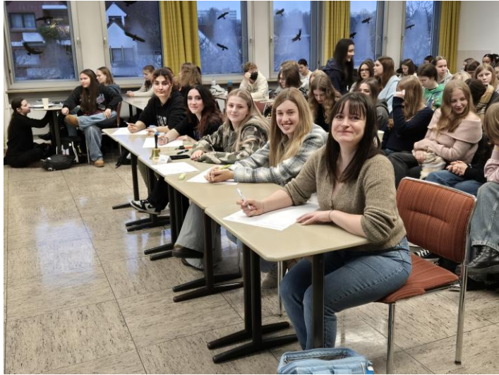
Die Jury der MSS bei der Arbeit

Anschließend fand die Debatte der Altersstufe II mit Schülerinnen der MSS 11 und 12 statt, in der die Frage: „Soll die Bewertung von Gruppenleistungen gegenüber Einzelleistungen in der Schule höheres Gewicht bekommen?“ debattiert wurde.