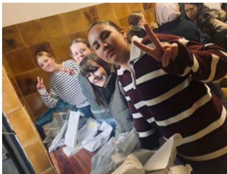
Unsere engagierten Schülerinnen