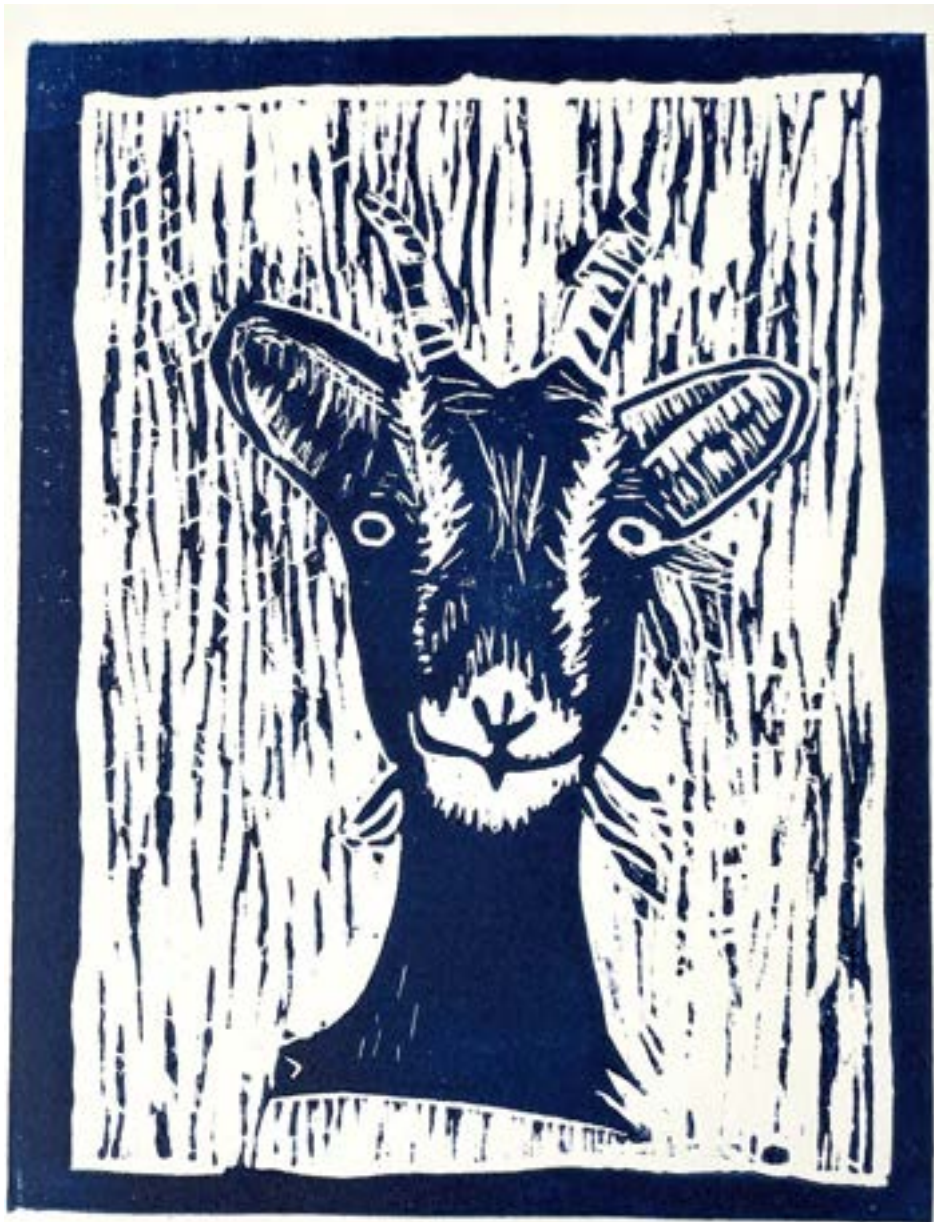
Leni Utzinger, MSS 13