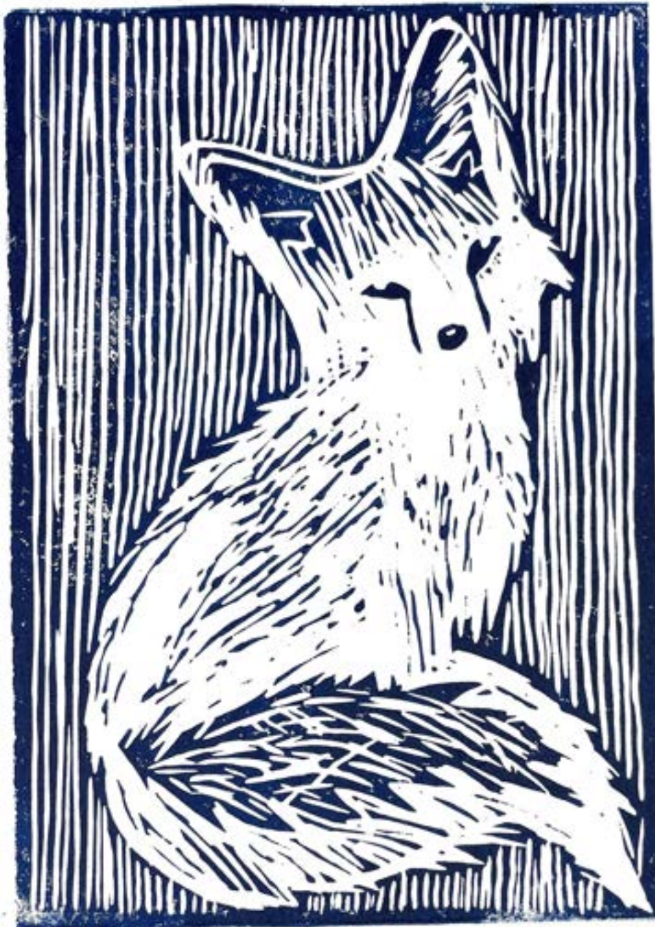
Simona Yehdego, MSS 13