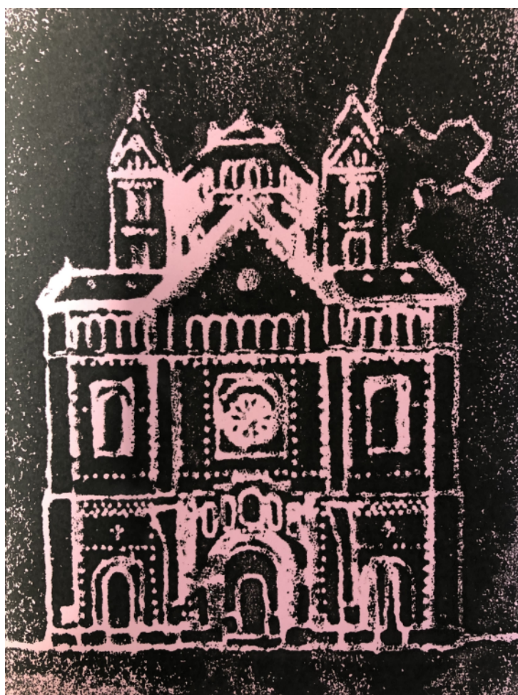
Rouha Kourdy (8b)