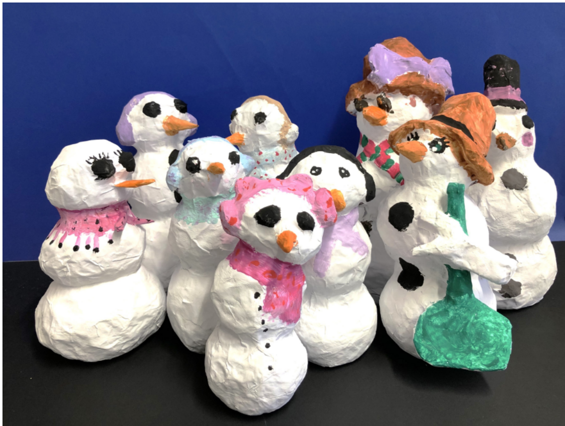
Schneemänner der Klasse 6c