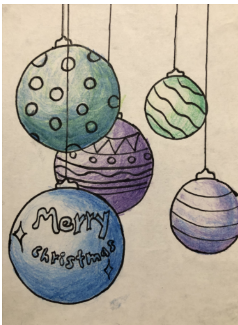
Mia Schilling (7a)