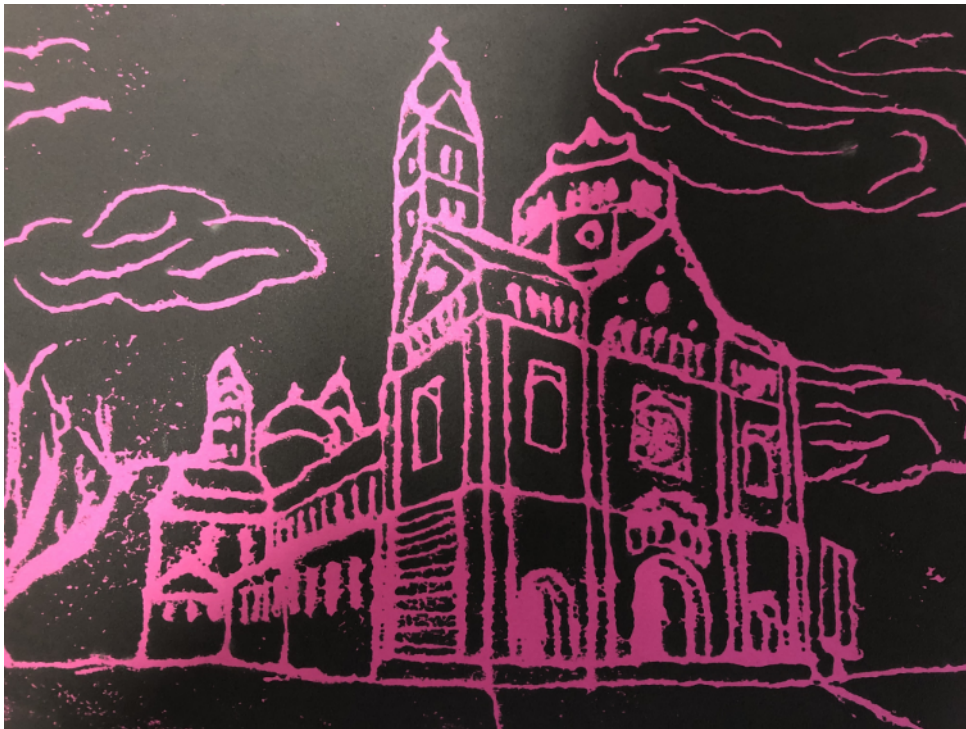
Maja Glock (8b)